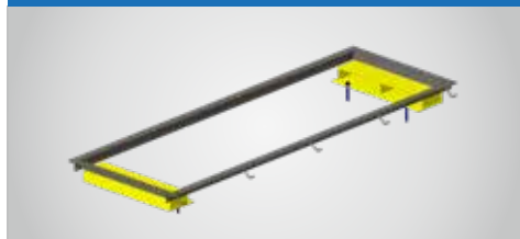
KIT DI MONTAGGIO A FILO