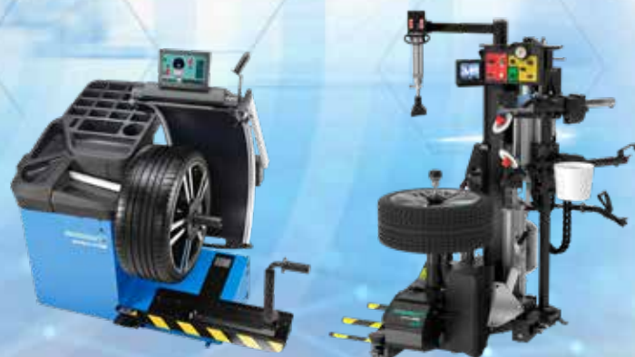
In perfetta combinazione con equilibratrici e smontagomme