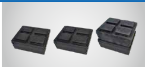
TAMPONI SOVRAPPONIBILI (1 SET DA 4) 1 KIT INCLUSO NELLA FORNITURA